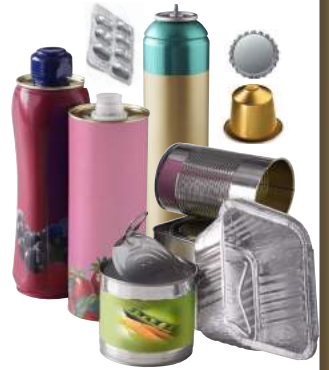
boîtes de conserve papier alu barquette alu déodorant canettes aérosol