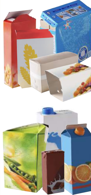
cartons d'emballages cartonnettes briques alimentaires