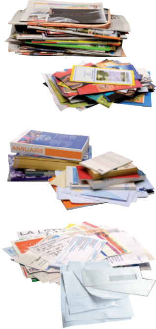
journaux - magazines courriers et enveloppes papiers de bureaux livres catalogues