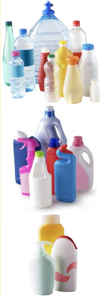
bouteilles et flacons uniquement